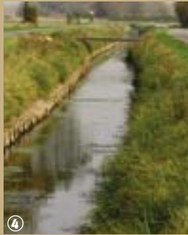
Calme - Loberghe

De mai à septembre, la Route du lin, parcours cyclo, chemine à travers les champs de lin de la campagne