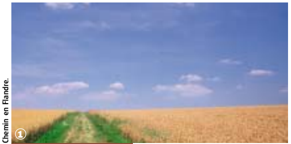
Chemin en Flandre.