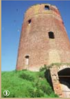
Moulin de briques.

Si la culture du lin se localise principalement sur une bande de 50 km de large, le long de la côte allant de Caen à Dunkerque jusqu'en Belgique et aux Pays Bas, saviez-vous qu'il compte parmi les fleurons du Nord ?