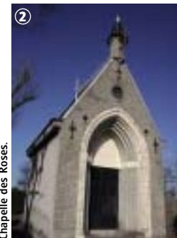
Chapelle des Roses.