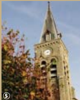
L'église de Drincham.

flamande. Si, en plus de marcher, vous aimez pédaler, participez à cette manifestation autour de la plante aux fleurs bleues où vous attendent des animations ainsi que des démonstrations de teillage de lin à l'ancienne.